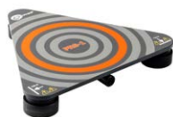
Sensore per misure della resistenza dei pavimenti e delle pareti PRS-1