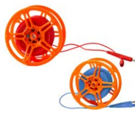
Cavi di prova per misura resistenza di terra 25 m rosso / blu