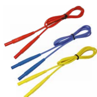
Cavi di prova 1,2 m (terminale banana) rosso / blu / giallo