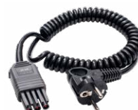
WS-04 adattatore con spina UNI-SCHUKO angolare