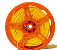
Cavi di prova per misura resistenza di terra 50 m