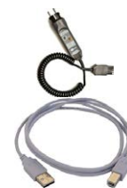
WS-03 adattatore con pulsante di START e spina UNI-SCHUKO