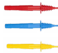
Terminali a puntale 1 kV (innesto banana) rosso / blu / giallo