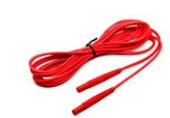
Cavo di prova per la misura dell'anello di guasto (terminale banana) 5 m / 10 m / 20 m