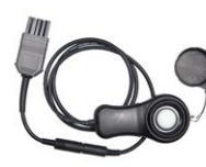
Sensore di illuminamento LP-1 con presa WS-06