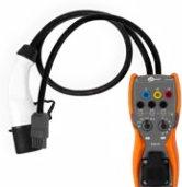
EVSE-01 adattatore per il test sulle colonnine di ricarica dei veicoli elettrici