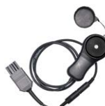
Sensore di illuminamento LP-10A con presa WS-06